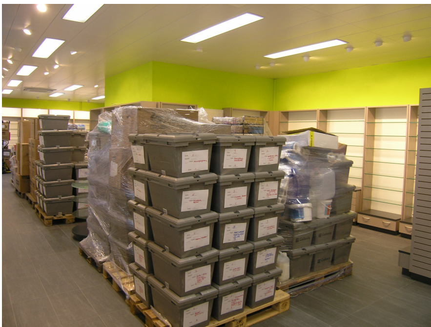
Mittwoch, 16. Oktober Anlieferung der neuen Drogerieartikel.