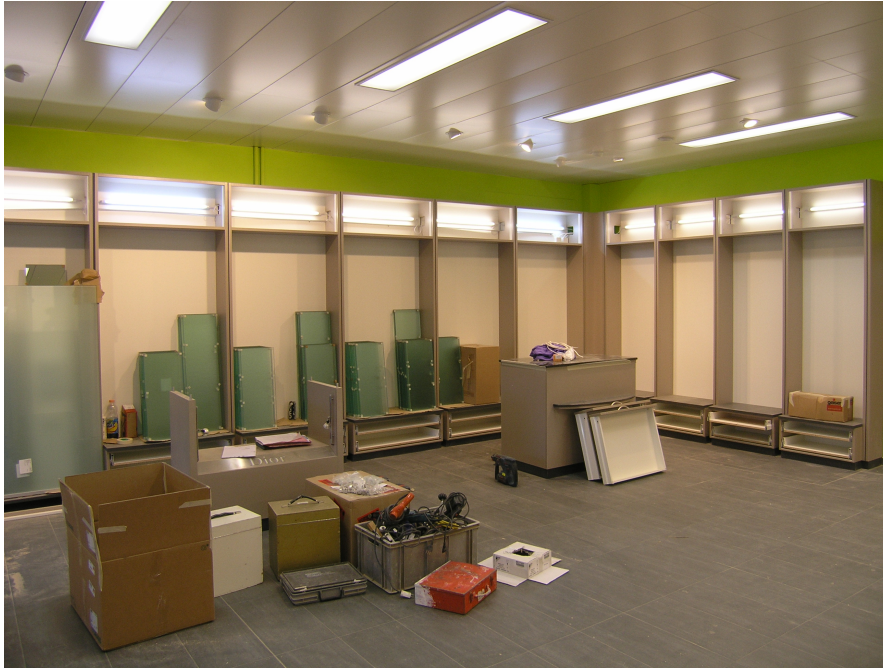
Dienstag, 15. Oktober Fertigstellen der Laden- einrichtung.