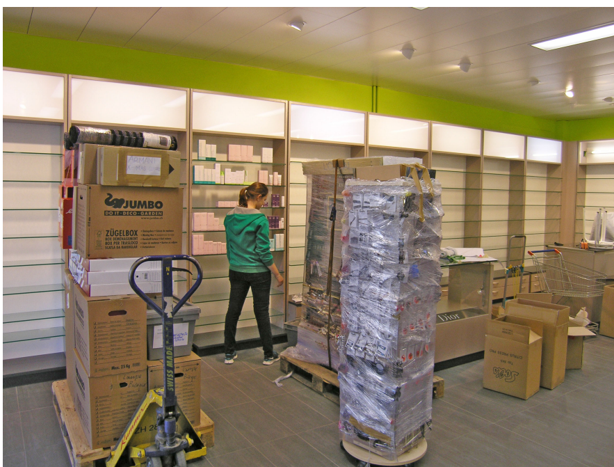
Donnerstag, 17. Oktober 1. Bestückung der Dro- gerieartikel.